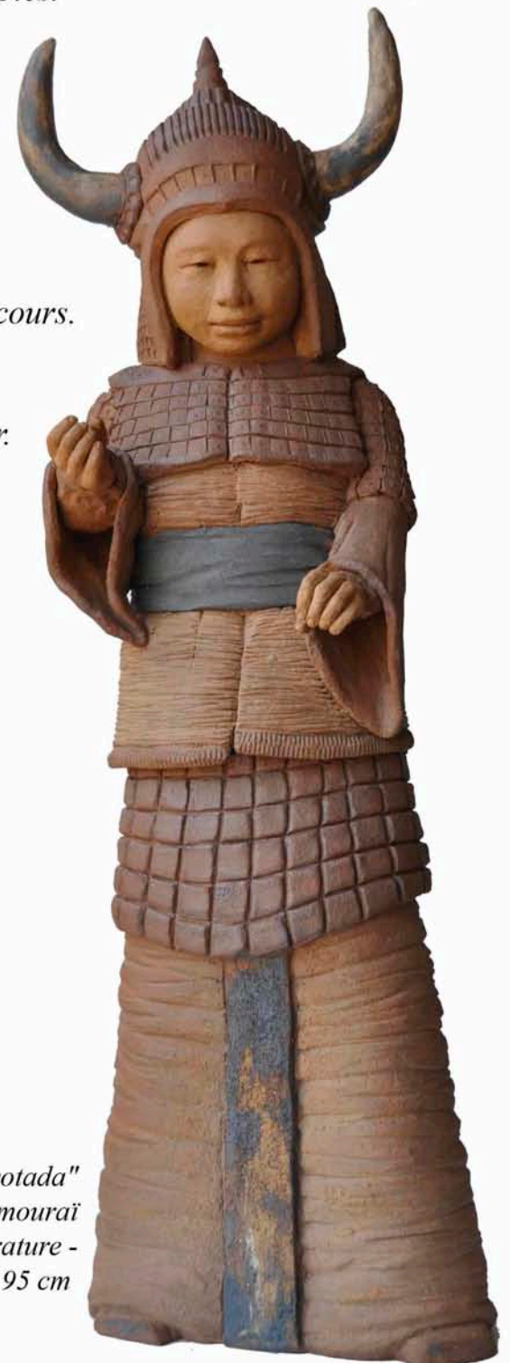
"Kiyotada" enfant samourai 2011 - haute température - 95 cm