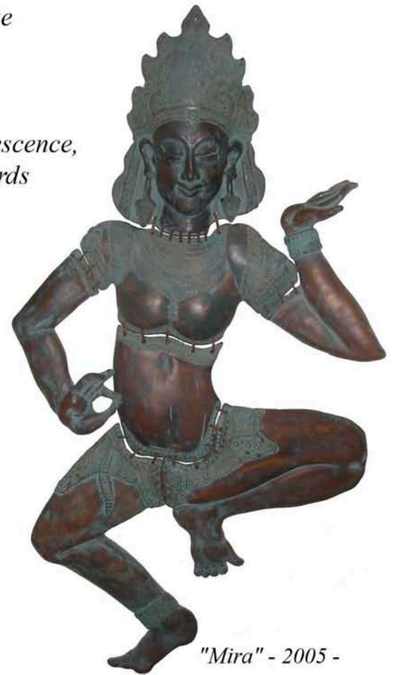
"Mira" - 2005 - patine

Et je façonne des animaux, qui conservent l'image de l'évolution du monde ».