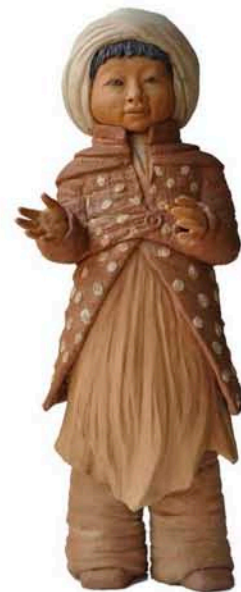
"Soma" enfant des Indes 2011 - haute température 86 cm

"Il est de ma parentèle" (Ototeman): Arbre d'Argile, Seigneur de la Paix, Berger, Animal mystérieux, Êtres de la forêt...tous issus de mon univers imaginaire, porteurs de mes rêves, évoqueurs de mes croyances ».