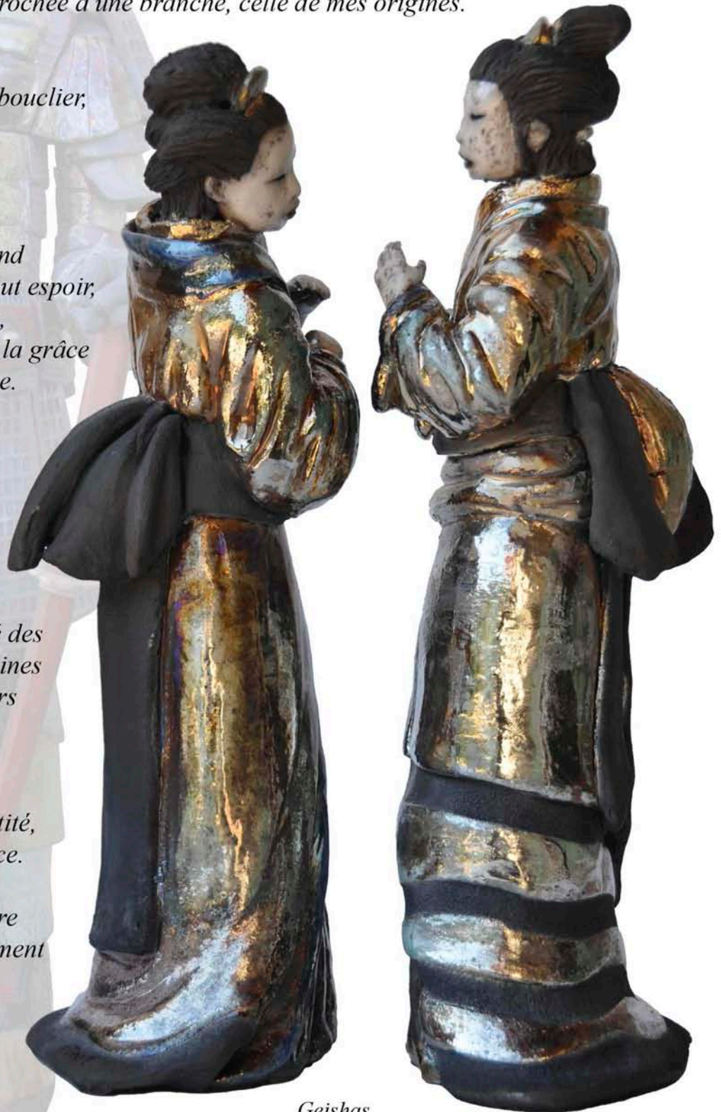
Geishas 2011 - raku - 38 cm