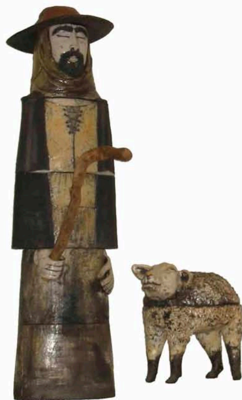
"Le berger de Loulou" - 2001 - raku - 110 cm