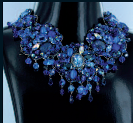
FLORA CRÉATION bijou porté par Miss Alsace 2011

Il s'agit de bijoux réalisés et offerts par 43 créateurs dans le cadre du Concours Miss France 2012.